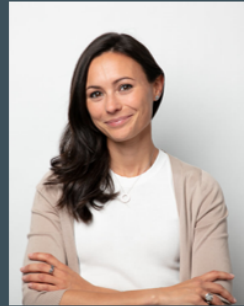
Foto: aktuell, freundlich, passend zum Beruf