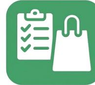
Administration, Verkauf, Logistik