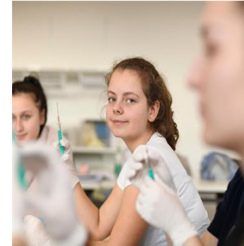
Berufe kennen lernen